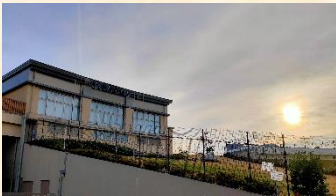
昨年の元旦の朝日に浮かび上がる「こどもの国」

皆様におかれましては、健やかに新春をお迎えのことと存じます。昨年は「こどもの国」をご利用くださりまして、誠にありがとうございました。おかげさまで、多くの皆様にご来館いただき、子どもたちの楽しい思い出づくりに少なからず関わることができましたことを大変嬉しく思い、皆様に心から感謝申し上げます。